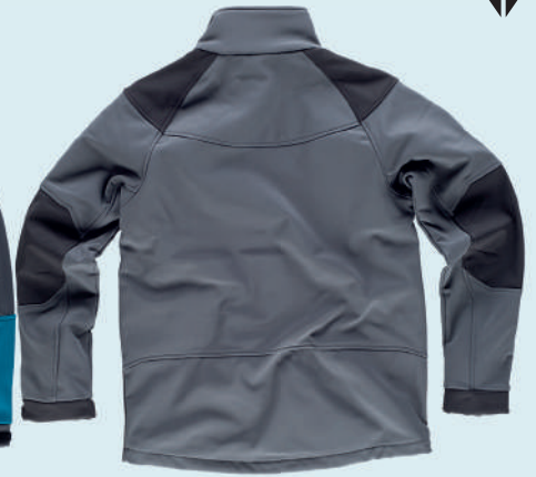
grigio scuro nero