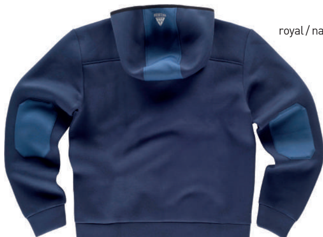
royal / navy