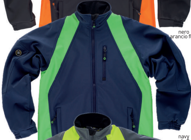
navy verde fluo