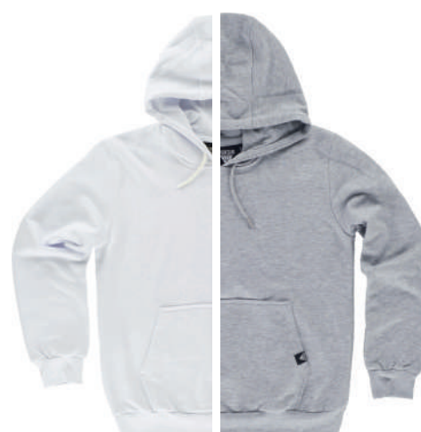
bianco grigio chiaro