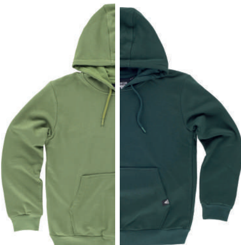
oliva verde scuro