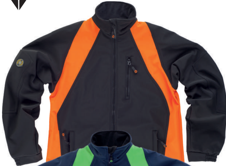
nero arancio fluo