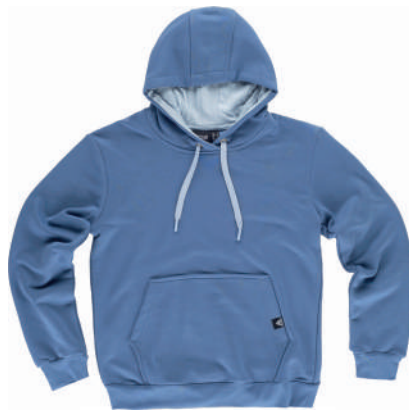
royal / azzurro