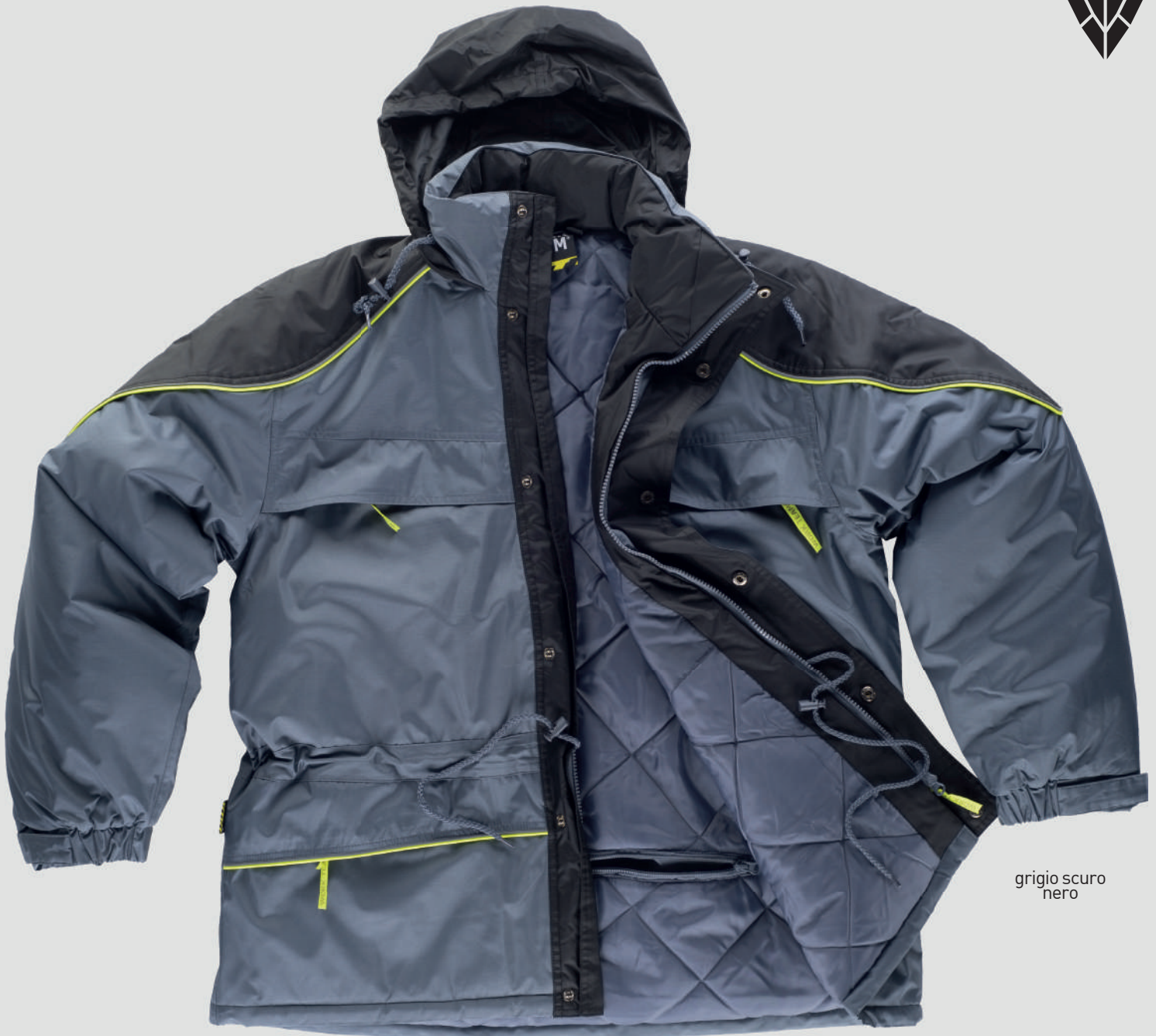
grigio scuro nero