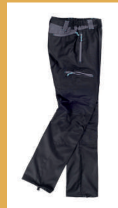
verde cacci marrone