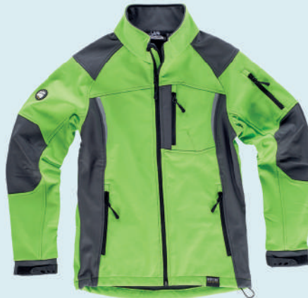
lime grigio scuro