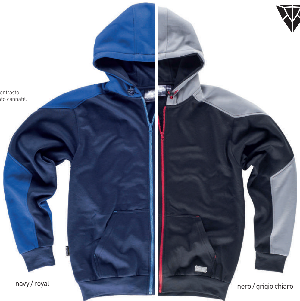
navy / royal

Tessuto: 80 % Poliestere 20% cotone Peso: 280 gr/m 2 Taglia ITA: S/3XL