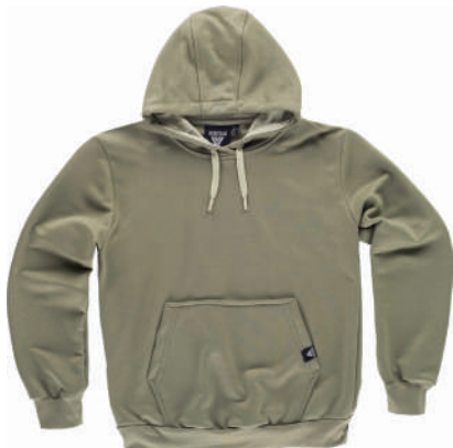
oliva / beige