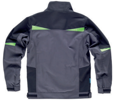
grigio scuro verde lime