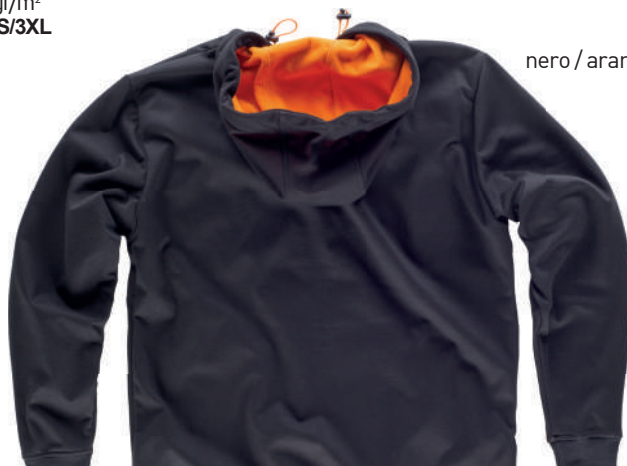
nero / arancio a.v.