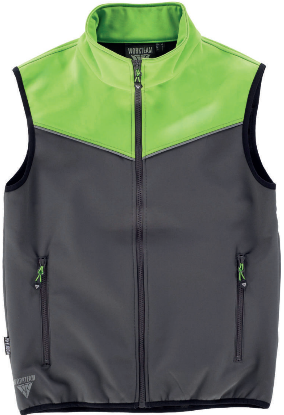
grigio giallo fluo