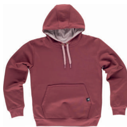
bordeaux / rosa