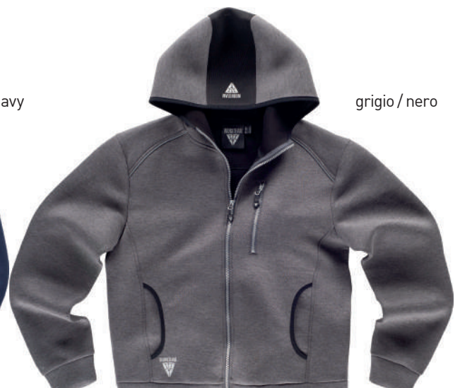
grigio / nero