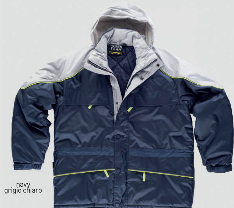
navy grigio chiaro

Tessuto: 100% Poliéstere Peso: 250 gr/m 2 Taglia ITA: S/2XL