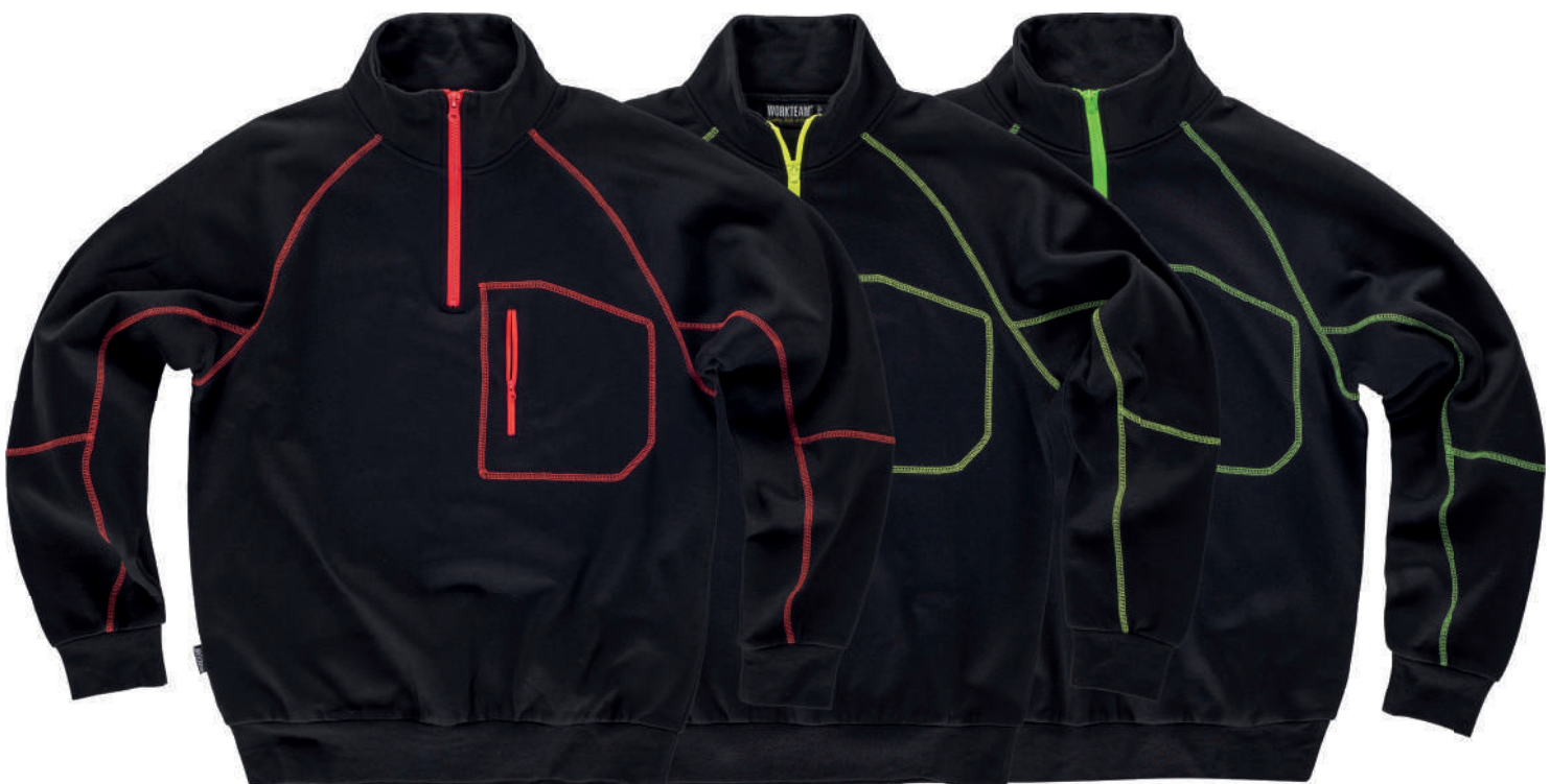
nero / rosso

Tessuto: 63 % Poliestere 35% cotone Peso: 280 gr/m 2 Taglia ITA: S/3XL