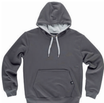
grigio scuro / grigio chiaro