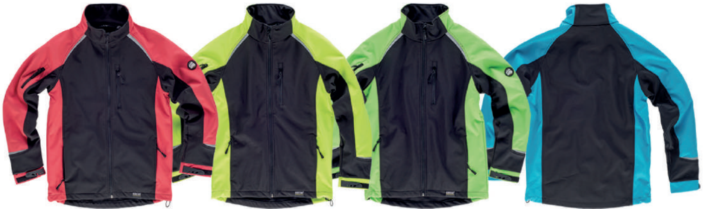
nero rosso fluo