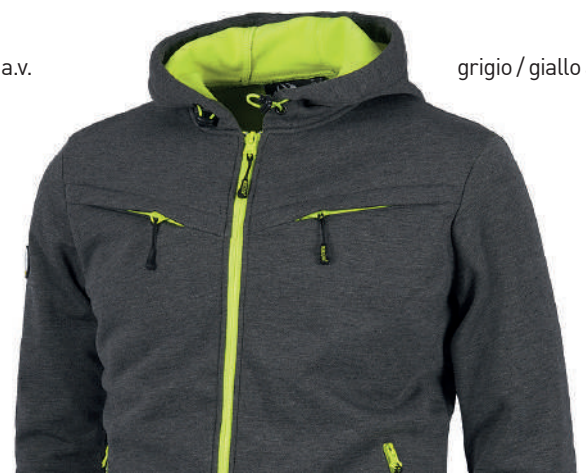
grigio / giallo a.v.