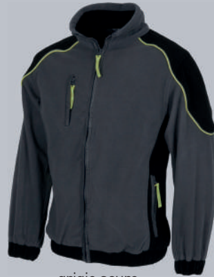
grigio scuro nero

Tessuto: 100% Poliestere Peso: 260 gr/m 2 Taglia ITA: M/2XL