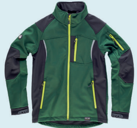
verde scuro nero