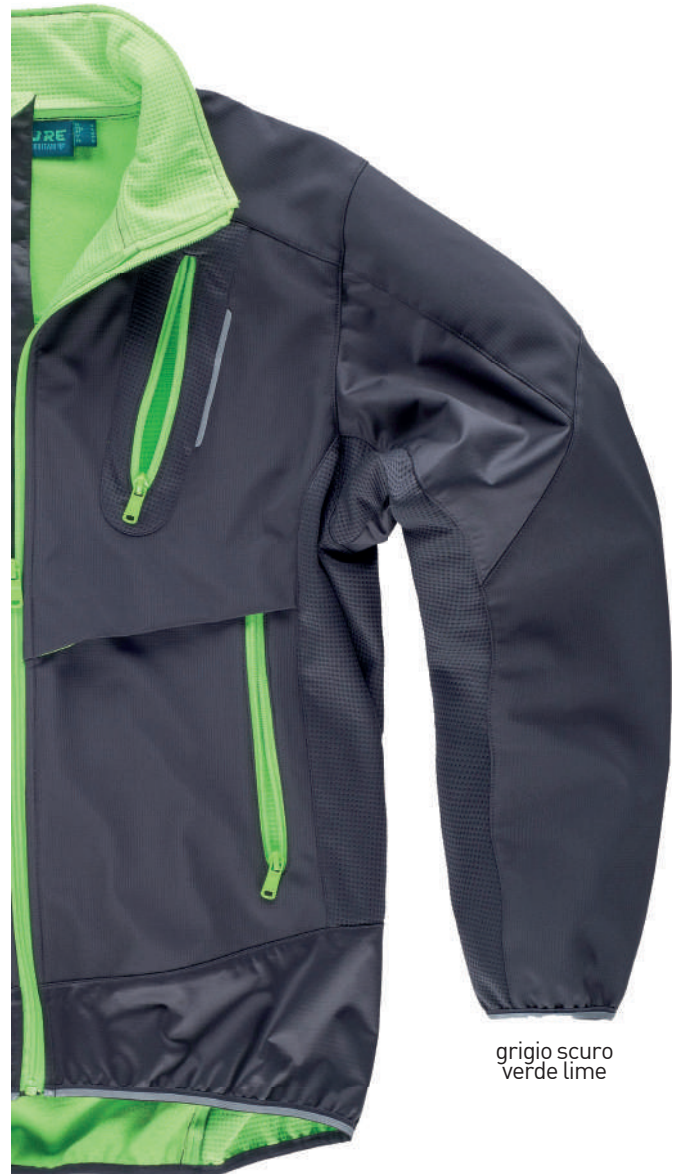
grigio scuro verde lime