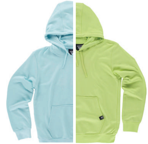
turchese chiaro lime