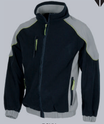
navy grigio chiaro