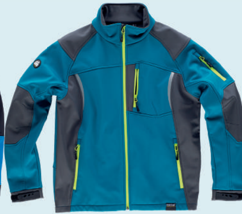
royal grigio scuro