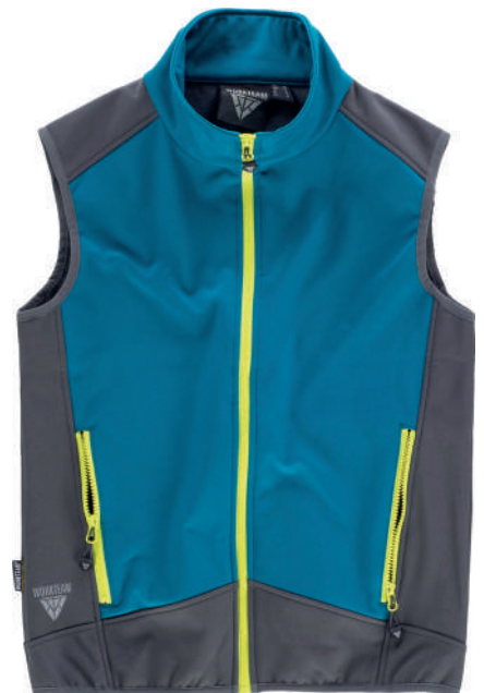
royal grigio scuro