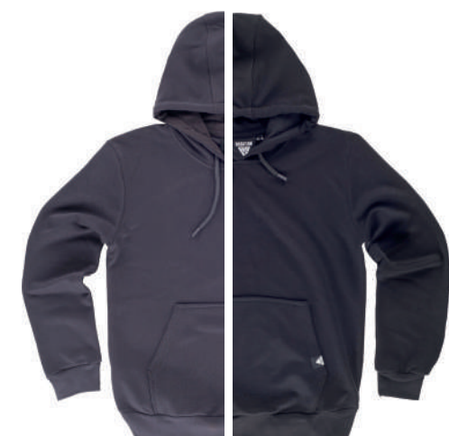
grigio scuro nero