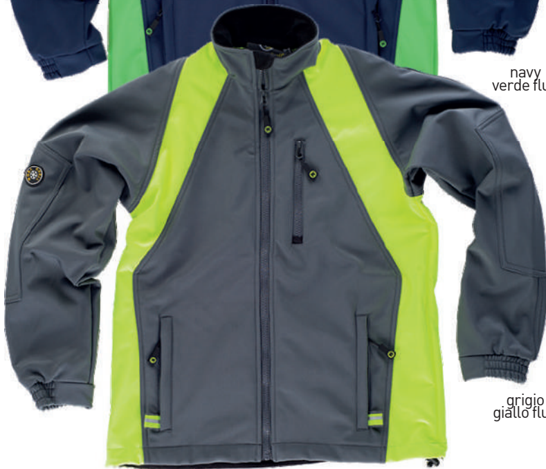
grigio giallo fluo