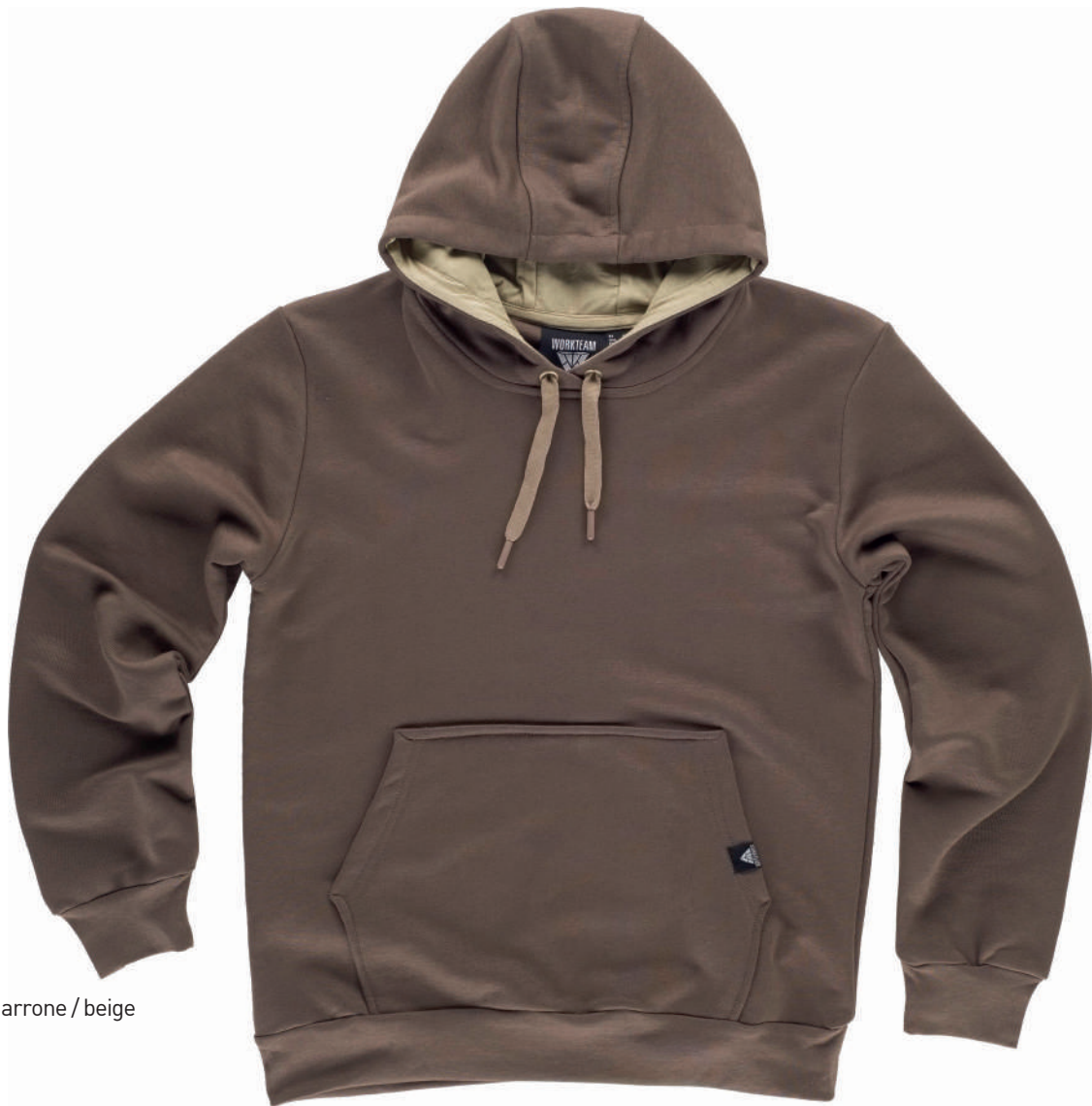
marrone / beige