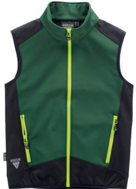
verde scuro nero